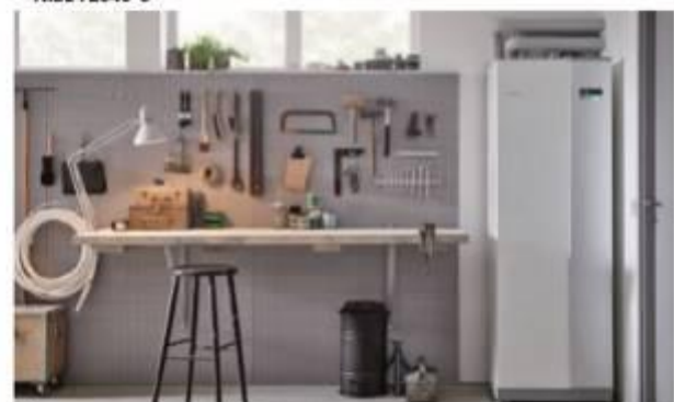
Tepelné čerpadlo NIBE F1355 je vhodné zejména do energeticky náročných interiérů