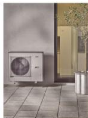
Systémová kombinace NIBE SPLIT se skládá z venkovní a vnitřní jednotky

Budoucnost tepelných čerpadel v Česku předurčuje a zaručuje stále se zvyšující poptávka po obnovitelných zdrojích energie, kterou motivuje celosvětová snaha snížit znečištění ovzduší a zmírnit dopad klimatických změn. Vývoj v EU navíc směřuje k výstavbě budov téměř s nulovou spotřebou energie (NZEB) a využití environmentálně šetrných a současně efektivních zdrojů je proto stále aktuálnější. V nově realizovaných stavbách sice požadavky na vý-