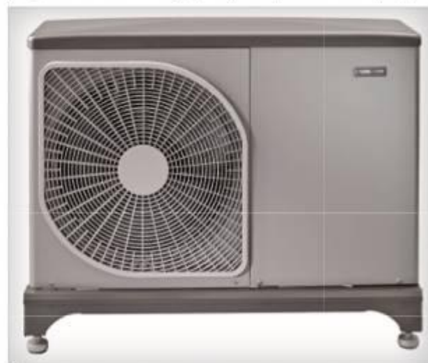
Letošní novinkou mezi tepelnými čerpadly vzduch-voda je model NIBE F2040-6

ní, a proto se stávající kotel využívá jen k pokrytí vytápěcích špiček. Při monoenergetickém provozu (kombinace tepelného čerpadla vzduch-voda a elektrického topného tělesa) je tepelné čerpadlo schopné pokrýt většinu požadavků na vytápění a topné těleso se zapíná pou-