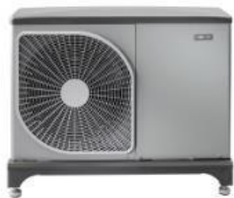
Venkovní tepelné čerpadlo systému vzduch-voda NIBE F2040-6

http://www.tzb-info.cz/t.py?t=55&i=122330