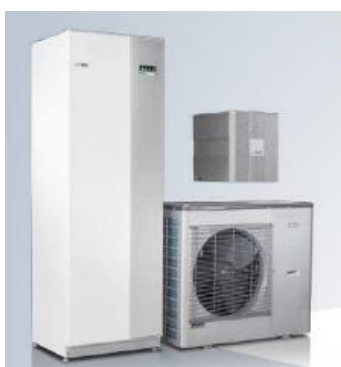
Základní zapojení se systémem ohřevu vody a vytápění HK 200S + AMS 10 + SMO

sestavu je možné spravovat pomocí tabletu nebo mobilního telefonu s přístupem na internet, a to prostřednictvím služby NIBE Uplink.