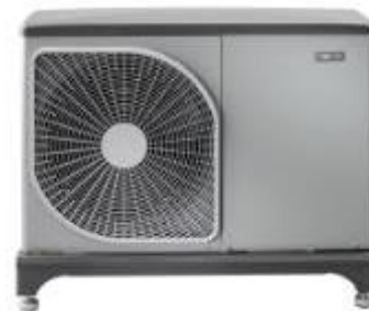
Venkovní tepelné čerpadlo systému vzduch-voda NIBE F2040-6

snižuje provozní náklady. Jeho součástí je rovněž praktická vana pro odvod kondenzátu a antivibrační spoje, jež zamezují možnému přenosu hluku a vibrací do otopné soustavy. Po propojení s vnitřní systémovou jednotkou VVM nebo regulátorem SMO, jež přispívají k optimalizaci jeho účinnosti a dosažení maximálních úspor, proto vzniká velmi efektivní zařízení pro vytápění, chlazení či ohřev vody s energetickou třídou A+++ a sezónním topným faktorem SCOP až 4,8.“