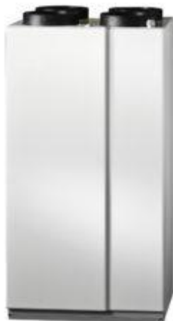
NIBE ERS 10-400

Vývoj udržitelného stavebnictví v České republice je úzce spjatý s implementací směrnice Evropské unie EPBD II o energetické náročnosti budov do tuzemské legislativy. Z dané právní úpravy vyplývá, že již od 1. ledna 2020 nedostane povolení k výstavbě žádná nová budova, která nenaplní parametry energeticky úsporného standardu. Společnost NIBE Energy Systems CZ, výhradní dodavatel švédských tepelných čerpadel NIBE do Česka a na Slovensko, proto přichází s vysoce efektivní rekuperační jednotkou NIBE ERS 10-400, která nabízí kompletní řešení mechanické ventilace s 92% účinností zpětného získávání tepla. Toto environmentálně šetrné zařízení v energetické třídě A tak přispívá k snížení energetické náročnosti objektu a vytváří zdravé a kvalitní vnitřní prostředí se stabilní teplotou a vlhkostí.