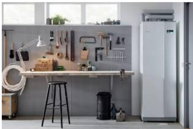
Tepelné čerpadlo systému země-voda NIBE F1355

Odpočinek u zahradního bazénu patří k jedné z nejoblíbenějších letních aktivit mnoha českých domácností. Teplé počasí je však velmi nestálé, a proto se dá koupat jen několik měsíců v roce – navíc i v létě nás mohou nepříjemně potrápit chladné dny. Jak si tedy plavkovou sezónu co nejvíce prodloužit? Neoptimálnějším řešením je kombinace vhodného zastřešení, které bazén ochrání před nepříznivými vnějšími vlivy, a tepelného čerpadla NIBE. Toto environmentálně šetrné zařízení totiž komplexně pokryje potřeby vašeho rodinného domu – vytápění, chlazení, větrání i ohřev vody v domácnosti a v bazénu.