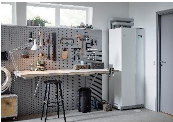
Tepelné čerpadlo systému země-voda NIBE F1355