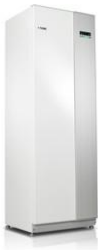
Tepelné čerpadlo systému země-voda NIBE F1355

https://vytapani.tzb-info.cz/tepelna-čerpadla/17634-tepelne-čerpadlo-zajisti-energeticky- usporny-ohrev-vody-v-bazenu