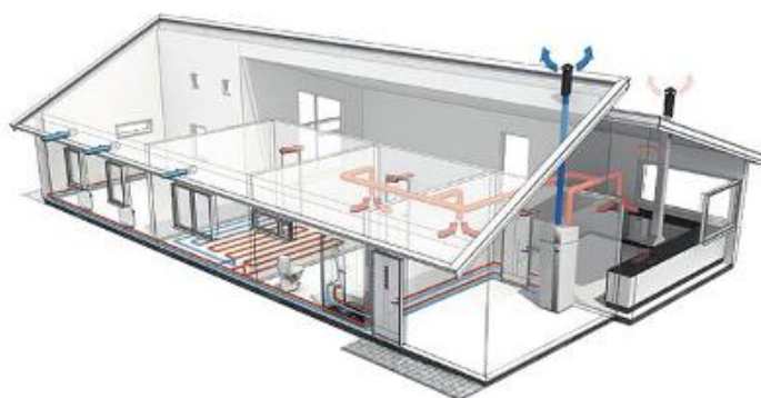
Obr. 2 • Schéma podtlakového větrání v rodinném domě [4]