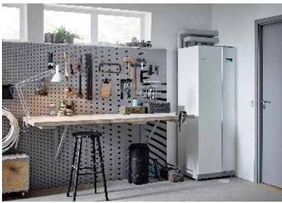
Tepelné čerpadlo systému země-voda NIBE F1355

Pro ohřev vody v bazénu se standardně využívají solární panely nebo speciální modely tepelných čerpadel s nízkým výkonem, které však již nenabízí další přídavné funkce. Mnohem efektivnějším řešením je využití environmentálně šetrného systému, který zajistí nejen samotný ohřev, ale také energeticky úsporné vytápění nebo chlazení rodinného domu a přípravu teplé vody pro celou domácnost. Hlavním prvkem této soustavy je tepelné čerpadlo systému země-voda nebo vzduch-voda. Jen pozor na ventilační tepelné čerpadlo – tím vodu v bazénu ohřívat nelze.