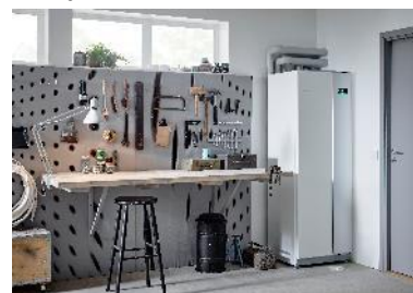
Tepelné čerpadlo systému země-voda NIBE F1355

Tepelná čerpadla systému vzduch-voda patří k nejprodávanejšimu typu v rámci celé České republiky: pro vytápění totiž využívají teplo obsažené ve venkovním vzduchu, snadno se instalují i ovládají a lze je umístit v jakémkoli terénu bez nutnosti hlubinného vrtu a vysoké počáteční investice. S velkým odstupem se za nimi drží tepelná čerpadla systému země-voda, jejichž instalace je obtížnější a finančně náročnější. Je s nimi však možné dosáhnout až 80% úspory energie.