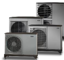
Tepelná čerpadla systému vzduch-voda NIBE F2040