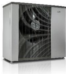
Tepelné čerpadlo systému vzduch-voda NIBE F2120

Podle průzkumu Evropské asociace tepelných čerpadel se v roce 2017 v Evropě instaloval více než 1 mil. kusů tepelných čerpadel, čímž se dosáhlo 10 mil. nainstalovaných zařízení. Tento vývoj ovlivnil zvýšený zájem o alternativní zdroje energie, které nejsou závislé na fosilních palivech a k nimž se řadí také tepelná čerpadla. Ta totiž využívají teplo z přírodních zdrojů: vody, vzduchu nebo země, které se v opakovaném cyklu přečerpává z nižší teploty na vyšší a následně se s ním účelně vytápí, chladí, větrá nebo ohřívá voda. Minimalizují se tak škodlivé emise vypouštěné do ovzduší a snižuje energetická náročnost nemovitosti. Obliba tepelných čerpadel proto stále stoupá a podle aktuálních prognóz tak mohou prodeje i v České republice nadále růst: v průměru až o 35 nebo 40 %.