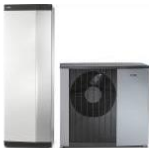
Vnitřní systémová jednotka VVM S320 a tepelné čerpadlo systému vzduch-voda NIBE F2120

Inovativní řada NIBE „S“ , která postupně nahrazuje stávající modely tepelných čerpadel NIBE, vznikla se záměrem rozšíření komunikace s okolním světem, respektive s vlastním příslušenstvím a dalšími komponenty tzv. chytré domácnosti. „Podobným směrem se ubíral i vývoj nové vnitřní jednotky VVM S320, která je alternativou k modelu VVM 320, určenou pro příznivce moderních komunikačních technologií. Díky svému jedinečnému regulátoru s dotykovým displejem a integrované Wi-Fi dokáže efektivně spolupracovat s dalšími komponenty v domácnosti, automaticky regulovat vnitřní klima a vytvářet tak zdravé a komfortní vnitřní prostředí s příjemnou pobytovou teplotou. Po jejím propojení s tepelným čerpadlem systému vzduch-voda NIBE F2040, či F2120, nebo s některou z kombinací venkovní jednotky AMS s vnitřním modulem HBS 05 vznikne ekologicky šetrný a vysoce účinný zdroj tepla pro celou domácnost,“ vysvětluje Jiří Sedláček, ředitel prodeje NIBE Energy Systems CZ , divize skupiny NIBE.