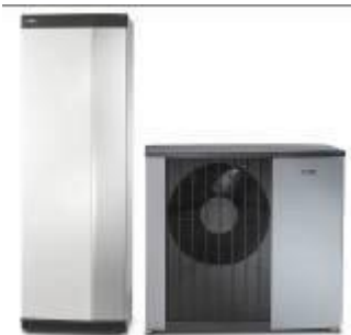
Vnitřní systémová jednotka VVM S320 a tepelné čerpadlo systému vzduch-voda NIBE F2120

Inovativní řada NIBE „S“ , která postupně nahrazuje stávající modely tepelných čerpadel NIBE, vznikla se záměrem rozšíření komunikace s okolním světem, respektive s vlastním příslušenstvím a dalšími komponenty tzv. chytré domácnosti. „Podobným směrem se ubíral i vývoj nové vnitřní jednotky VVM S320, která je alternativou k modelu VVM 320, určenou pro příznivce moderních komunikačních technologií. Díky svému jedinečnému regulátoru s dotykovým displejem a integrované Wi-Fi dokáže efektivně spolupracovat s dalšími komponenty v domácnosti, automaticky regulovat vnitřní klima a vytvářet tak zdravé a komfortní vnitřní prostředí s příjemnou pobytovou teplotou. Po jejím propojení s tepelným čerpadlem systému vzduch-voda NIBE F2040, či F2120, nebo s některou z kombinací venkovní jednotky AMS s vnitřním modulem HBS 05 vznikne ekologicky šetrný a vysoce účinný zdroj tepla pro celou domácnost,“ vysvětluje Jiří Sedláček, ředitel prodeje NIBE Energy Systems CZ , divize skupiny NIBE.