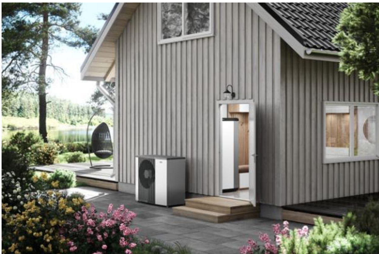
Vnitřní systémová jednotka VVM S320 a tepelné čerpadlo systému vzduch-voda NIBE F2120

Efektivní vnitřní systémová jednotka VVM S320 je typickým zástupcem inovativní řady tepelných čerpadel a jejich příslušenství NIBE „S“, kterou na český trh uvedla společnost DZ Dražice (člen skupiny NIBE).