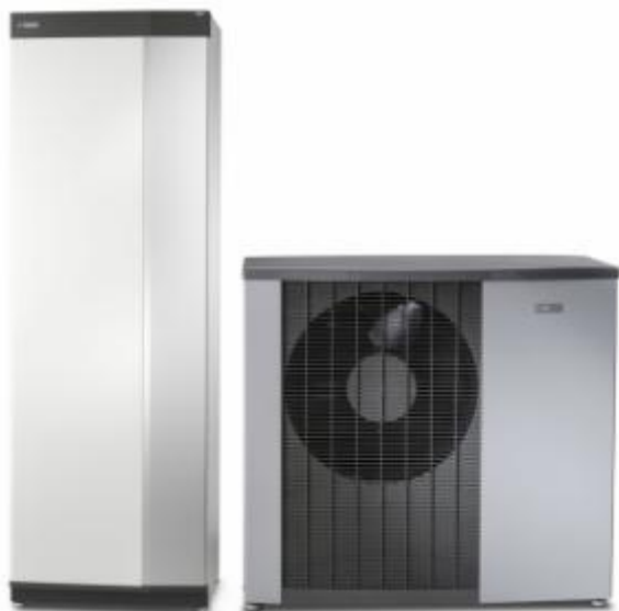
Vnitřní systémová jednotka VVM S320 a tepelné čerpadlo systému vzduch-voda NIBE F2120

komponenty v domácnosti, automaticky regulovat vnitřní klima a vytvářet tak zdravé a komfortní vnitřní prostředí s příjemnou pobytovou teplotou. Po jejím propojení s tepelným čerpadlem systému vzduch-voda NIBE F2040, či F2120, nebo s některou z kombinací venkovní jednotky AMS s vnitřním modulem HBS 05 vznikne ekologicky šetrný a vysoce účinný zdroj tepla pro celou domácnost,” vysvětluje Jiří Sedláček, ředitel prodeje NIBE Energy Systems CZ , divize skupiny NIBE.