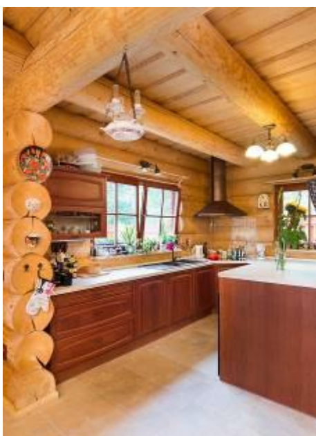
Obr.: Protože truhlář neměl kde hotovou kuchyni skladovat, musela se i přes posunuté termíny dokončení stavby namontovat. Byla tak paradoxně jednou z prvních funkčních věcí, přestože kvůli ochraně musela ještě dlouho zůstat pečlivě zaplachtovaná.