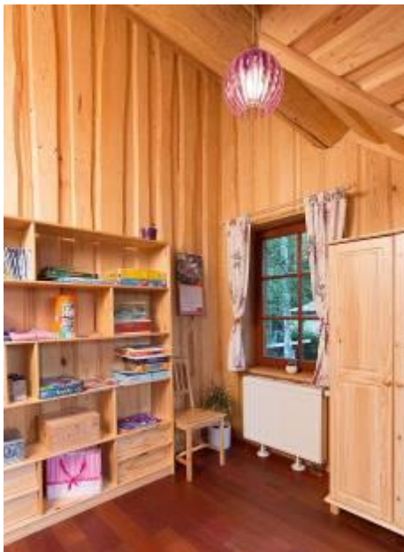
Obr.: Majitelé domu nechtěli mít v interiéru jedinou bílou stěnu. V přízemí jsou proto některé zdi obložené kamenem, v patře najdeme zase překládaná prkna.