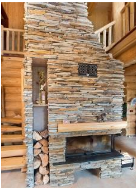
Obr.: Kamenný krb majitelé domu používají více k dekoračním účelům než jako zdroj tepla. Velký kamenný krb, který bude dominovat společenskému prostoru, byl ostatně jednou z hlavních podmínek při návrhu domu.