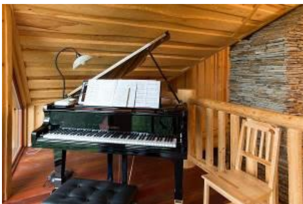
Obr.: Zabalený klavír vážil skoro 300 kg a do prvního podlaží ho museli vyzvednout již v průběhu výstavby. Když se pak v patře dělaly dřevěné podlahy, muselo se těžké břemeno několikrát stěhovat. O to větší radost ale teď svým majitelům přináší.