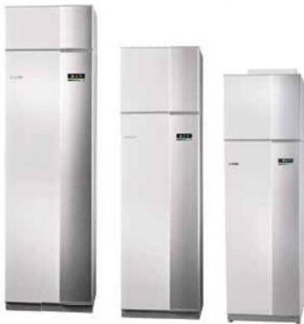
Ventilační tepelná čerpadla F370, F750 a F730 (NIBE)

Díky ventilačnímu tepelnému čerpadlu výrazně snížíte náklady na vytápění, a navíc budete dýchat čerstvý vzduch.