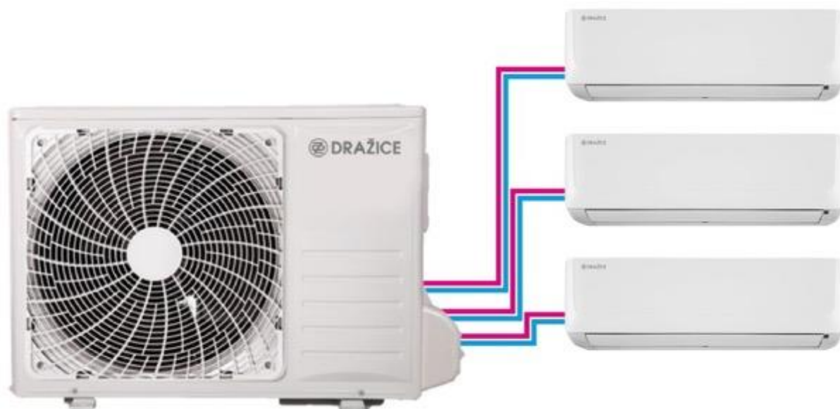
Klimatizace AIR PLUS typu multisplit

V současné době trávíme až 90 % času v uzavřených prostorách svých kanceláří a domovů, a proto bychom se měli ještě více zajímat o kvalitu jejich vnitřního prostředí. Dlouhodobé dýchání přehřátého, vysušeného nebo příliš vlhkého vzduchu plného škodlivin a plísní totiž může ovlivnit naše fyzické i psychické zdraví a vyvolat u nás tzv. syndrom nezdravých budov (SBS – Sick Building Syndrome).