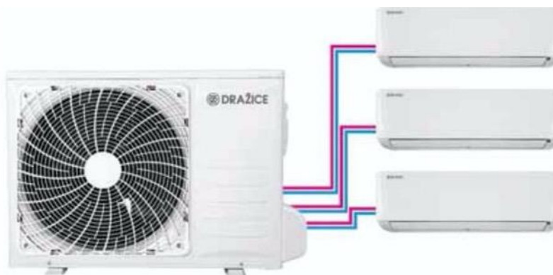
Multisplit AIR Plus Trio – jedna venkovní jednotka se třemi vnitřními zajistí optimální komfort v celém bytě

Moderní invertorová technologie plynule přizpůsobuje výkon požadované teplotě. Provoz se vyznačuje vynikající energetickou účinností chlazení A++ a topení A+